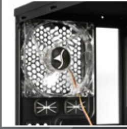
後置 120 mm LED 風扇