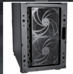
前置 2 個 120 mm 風扇 含濾網