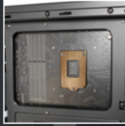
CPU cooler 背板 快速安裝孔位