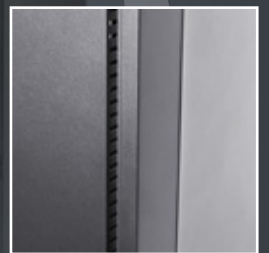
高效率靜音進氣孔