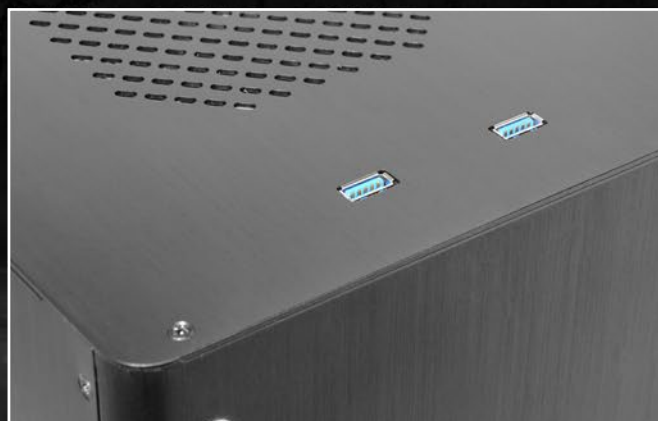
Góra z dwoma portami USB 3.0