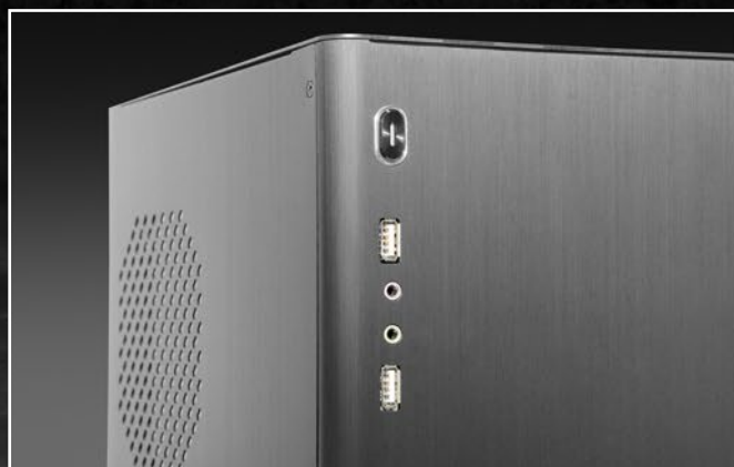
Przód z portami audio i USB